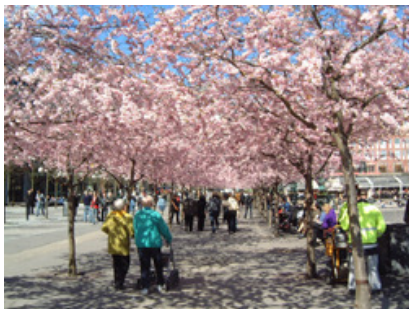
4月下旬 春の訪れを感じまして、王立公園の日本の桜の花見をしてきました。

小鳥などの動物をいじめたりしないこの国では、小鳥の側まで近寄っても逃げることはありません。住宅地の中にある我が家の庭にも、ハリネズミやキツツキ、野うさぎ、時には小鹿など、自然の中に住んでいる動物たちがひょっこりと訪問してくれます。