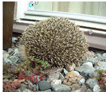
わが家の訪問者ハリネズミ、この日は春の暖かい日差しの中、窓の外で居眠りしていました。