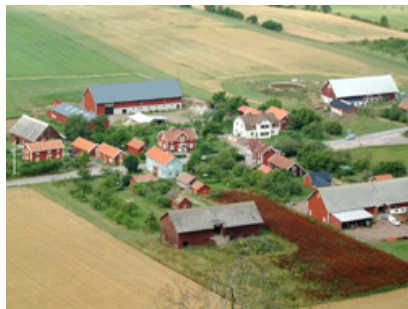
山の上から眺めた田舎の住宅地