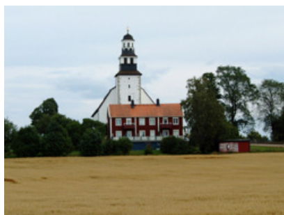
田舎のちいさな教会です。畑の真ん中に立っていました。