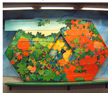
ストックホルムの地下鉄駅の壁やプラットフォームには、それぞれ美しい芸術品があり鑑賞することができます。

お便りの取り扱いについて | 放送中にお届けした曲 | 「地球ラジオ」携帯サイトについて | R1 NHK ラジオ第1 | NHK ワールド | NHK オンライン トップ